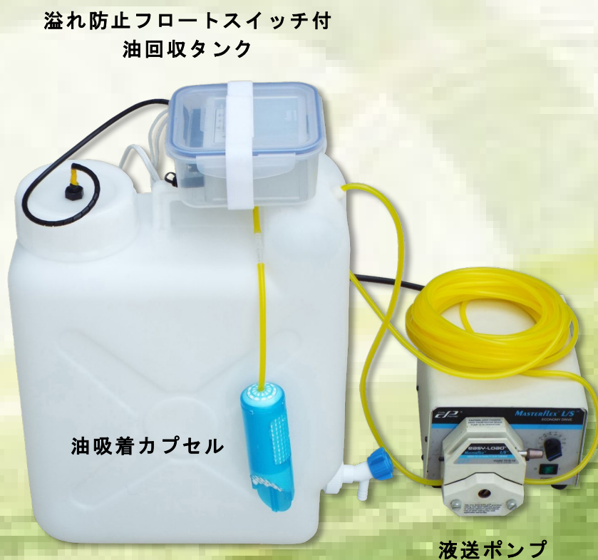
孔内油層回収装置