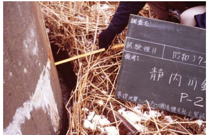
静内から浦河の海岸線