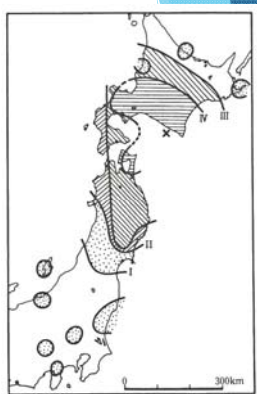
(宇佐美龍夫による)